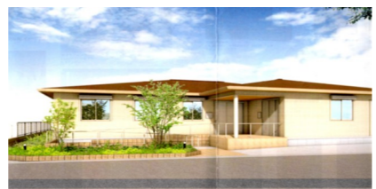
完成図（一月末完成予定）

《新住所》 堺市西区草部 493番1 JR阪和線鳳駅下車 草部バス停下車 徒歩5分