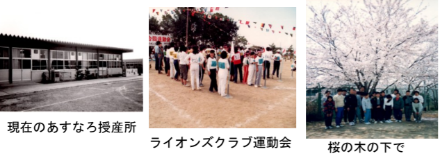
現在のあすなる授産所 ライオンズクラブ運動会 桜の木の下で