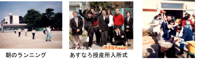
朝のランニング あすなる授産所入所式 クラウンタクシー餅つき